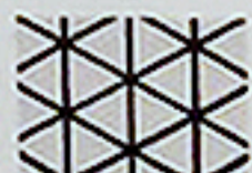
トラス=三角形の集合体

内部クッションは、三角形を組み合わせて配置した独自形状。圧を吸収しすばやく元の形に戻る、復元力の高いクッションです。