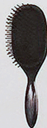
リファパドルプレミアム ¥9,900(税込)

頭皮へのフィット感も、心地よい刺激も。 極上の体感を叶えるダブルクッション構造。